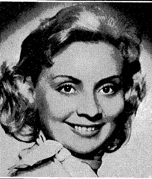
Annie Cordy Columbia SCRF 314